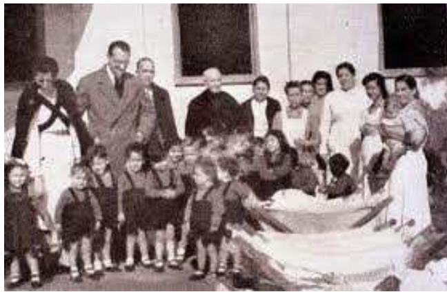
Prisión de Madres Lactantes, en Madrid.

Psicológicas. Los menores permanecían con sus madres apenas una hora al día, pasando el resto del tiempo separados, hasta que, al cumplir tres años, o incluso antes, eran montados en trenes con destino a sus nuevos hogares. Había casos más expeditivos, como apropiarse del bebé justo en el momento del parto o al ir a bautizarlo, aunque siempre era necesario detener a la madre en esos momentos, aunque fuera unas horas o unos días, normalmente bajo la acusación de sedición.