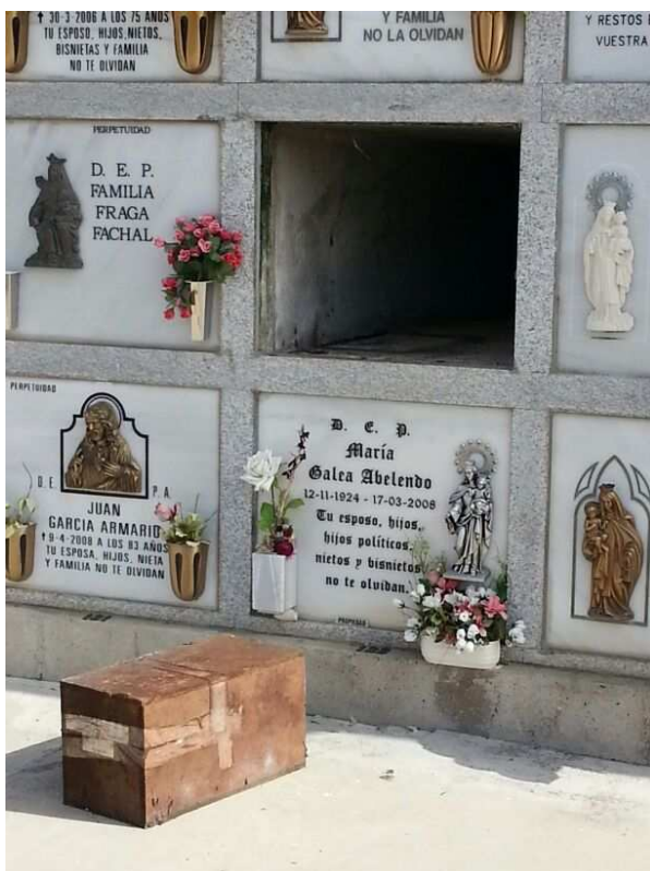
Exhumación reciente en Cádiz.