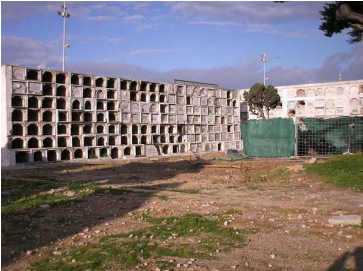
Cementerio San José de Cádiz.

El territorio más castigado por la presunta trama de robo de niños ha sido la provincia de Cádiz, por la sencilla razón de que durante muchas décadas, sobre todo en los años sesenta, setenta y ochenta, fue también una de las circunscripciones españolas con mayor tasa de natalidad. Allí es también donde más exhumaciones se están practicando y por ello mismo donde comenzaron a aparecer las primeras tumbas vacías de supuestos neonatos fallecidos.