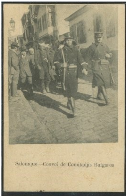
<< Prisioneros macedonios en Salónica

Esta represión fue pronto utilizada por el movimiento de liberación como base para lanzar una campaña contra la política turca, así como para recolectar ayuda material y canalizar el apoyo moral a la población de Macedonia y Tracia y a todos aquellos forzados a irse de aquellas regiones.