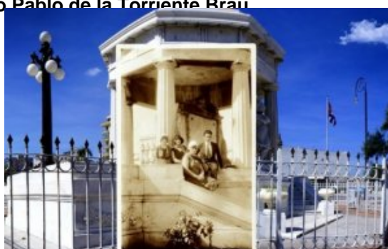
Pablo de la Torriente Brau, con tres de sus hermanas, en el monumento a los estudiantes de Medicina, junto al Malecón habanero.